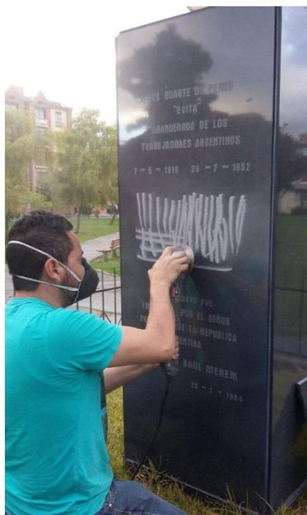
Fotografía 4. Pulido previo para asegurar adecuada adherencia.