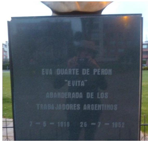
Fotografía 3: Detalle de la inscripción superior