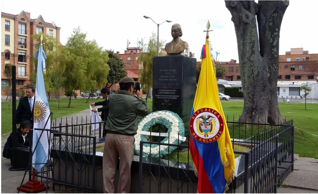
Fotografía 11. Acto conmemorativo de inauguración de la placa el día 27 de Julio de 2015, con motivo del 63er. aniversario de la muerte de la Eva Perón (26 de Julio 1952)