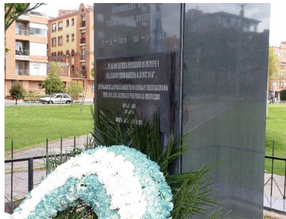
Fotografía 13. Detalle de la placa el día del acto conmemorativo de inauguración de esta el día 27 de Julio de 2015.