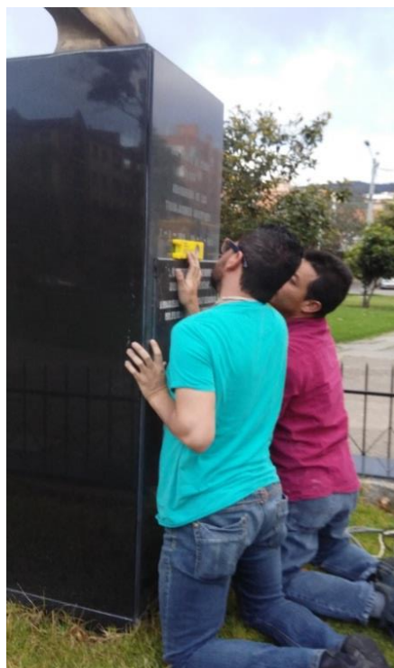
Fotografía 6. Ajuste con nivel de la placa para garantizar su horizontalidad.