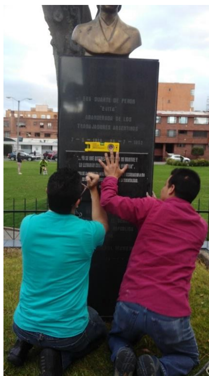
Fotografía 7. Ajuste con nivel de la placa para garantizar su horizontalidad.