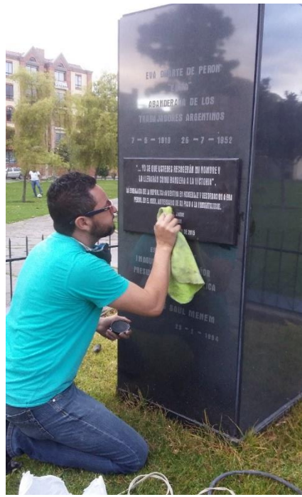
Fotografía 9. Aplicación de capa de protección bituminosa.

El acto inaugural de esta placa fue realizado por la Embajada de Argentina el Lunes 27 de Julio de 2015 a las 10:00 a.m.