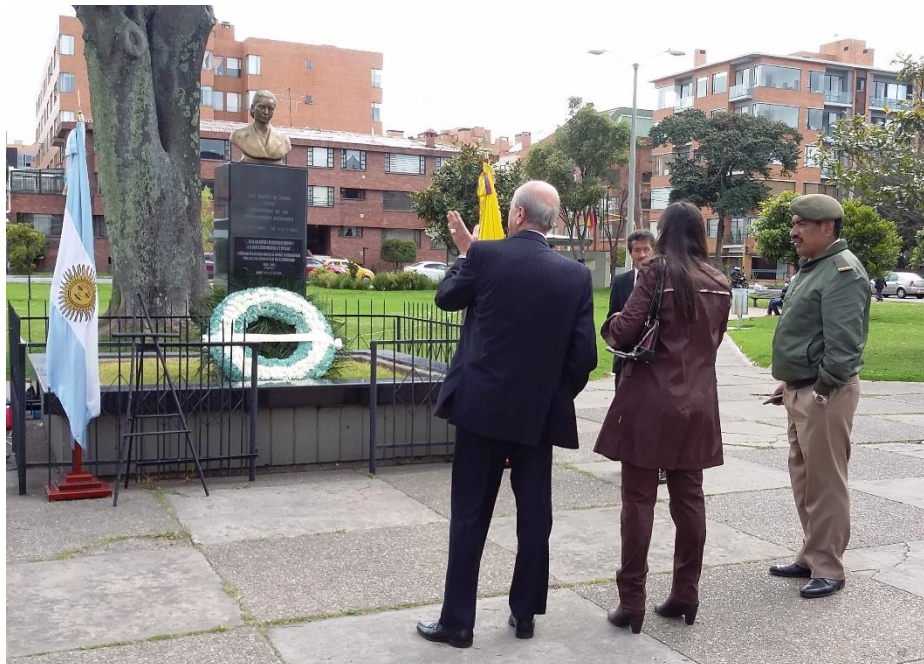
Fotografía 10. Acto conmemorativo de inauguración de la placa el día 27 de Julio de 2015, con motivo del 63er. aniversario de la muerte de la Eva Perón (26 de Julio 1952)

El acto inaugural de esta placa fue realizado por la Embajada de Argentina el Lunes 27 de Julio de 2015 a las 10:00 a.m.