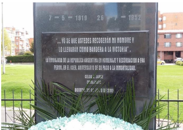
Fotografía 12. Detalle de la placa el día del acto conmemorativo de inauguración de esta el día 27 de Julio