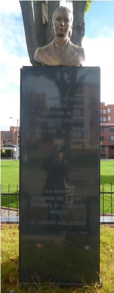
Fotografía 2: Vista frontal con inscripciones