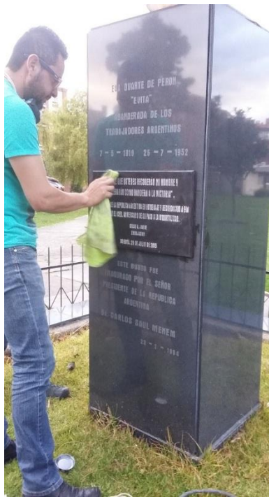
Fotografía 8. Limpieza de suciedad.