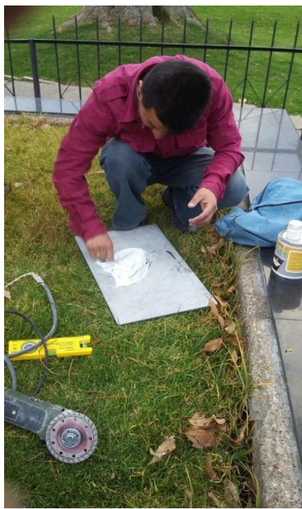
Fotografía 5. Aplicación resina poliéster sobre el reverso de la placa.