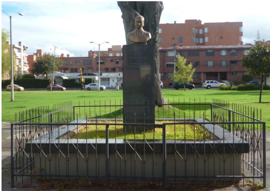
Fotografía 1: Vista general del monumento a Eva Perón.