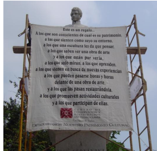
Fernández Madrid, 2007