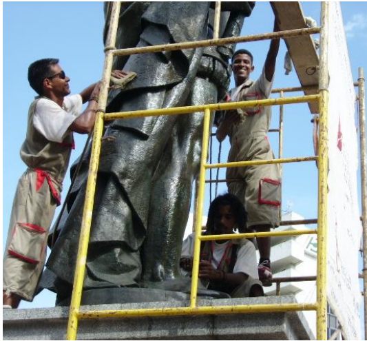
Pedro de Heredia, 2006