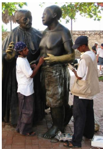
San Pedro Claver y Esclavo, 2002

A continuación, algunas fotos donde se puede observar el desarrollo y crecimiento del programa a través de los años que llevamos implementándolo.