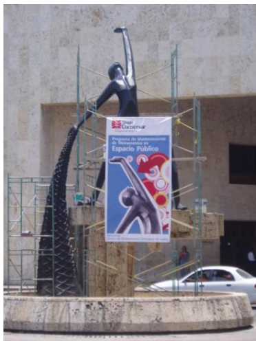
Valores de Cartagena, 2009