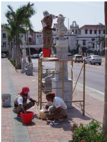
Camellón de los mártires, 2008