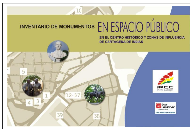
Portada del documento entregado en la I Etapa

En 2009, gracias al interés del Instituto de Patrimonio y Cultura de Cartagena, pudimos dar inicio a uno de los objetivos específicos del programa: el inventario de estos bienes. En este momento hemos desarrollado la primera etapa, donde recogimos la información básica de las esculturas que quedó consignada en las respectivas fichas de identificación. Como un aporte al documento, elaboramos fichas de estado de conservación para cada obra, para más adelante definir prioridades de intervención. Cuando culmine la investigación, se elaborará un catálogo para difundir la investigación de las obras.