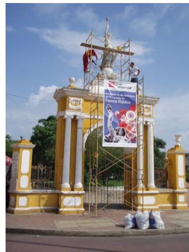
Portada del Parque Centenario, 2009